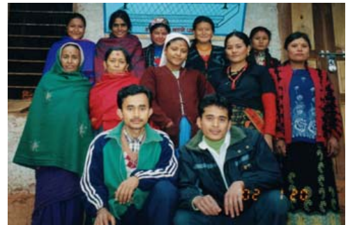
バル・ピパル学校 夜間成人クラス 教師2名と生徒10名(うち8名は奨学生)

また、成人生徒は上位 8 名に決まりましたが、以下 7 名も非常に努力したので、今回この 15 名(全員女性)に表 2 の奨学金を現金で寄与しました。合計 5,370 ルピー(約 9 千円)になります。